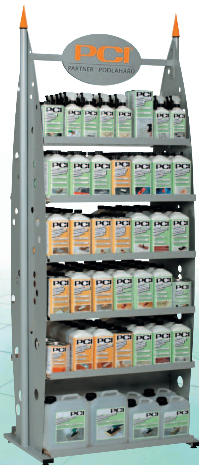
Stojan na PCI Čistící program 6 450 Kč