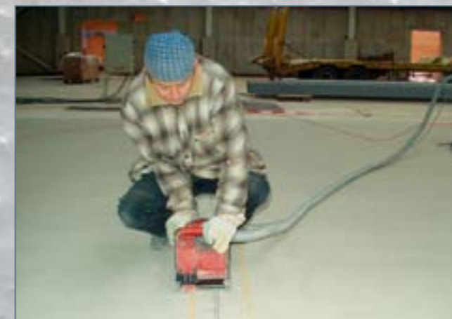
Frézování drážky u dilatační spáry

Kotvicí drážky se v případě použití penetrace UCRETE® PRIMER SC nebo LC také penetrují (penetrace se používají pouze pro tloušťky vrstvy podlahového systému UCRETE® 4 a 6mm a u větší tloušťky vrstvy penetraci doporučujeme).