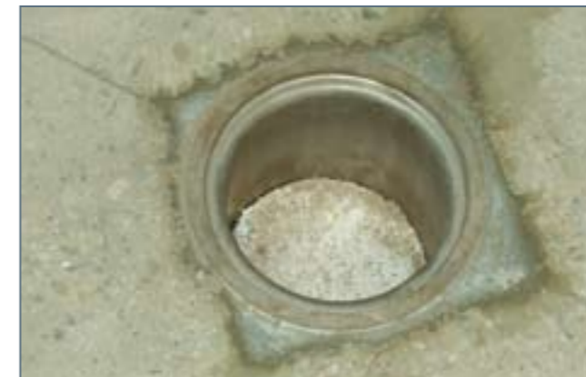
Drážka po obvodě podlahové vpusti

Kotvicí drážky je nutno před aplikací systémů UCRETE® MF a DP den před pokládkou vyplnit, aby nedocházelo k jejich „prokreslení“ do povrchu finální podlahy. Prokreslení způsobuje klesnutí aplikovaného materiálu do drážky, a ta po vytvrzení opticky vynikne do povrchu.