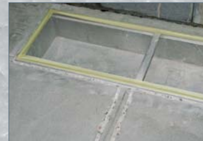
Připravená plocha s vyfrézovanými drážkami o rozměru 18x18mm v místě dilatace a podlahové vpusti pro aplikaci UCRETE® UD200 v tloušťce 9mm.