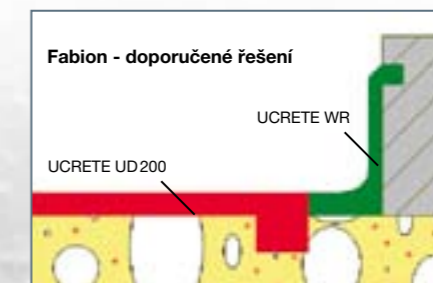
Příklad provedení kotvicí drážky v místě ukončení podlahy u fabionu

Aplikace podlahového systému UCRETE® je náročná a vyžaduje od aplikačních firem technologickou kázeň. Dohlížíme i na takové detaily, které pro uživatele po aplikaci podlahy nejsou patrné a viditelné. Certifikované aplikační firmy jsou velmi precizně vybírány a neustále pravidelně proškoleny. Každou aplikaci evidujeme a vyhodnocujeme tak, abychom zajistili pro další aplikace ten nejlepší servis pro vás, naše zákazníky. Ale takový je UCRETE® - DETAIL DĚLÁ PODLAHU.