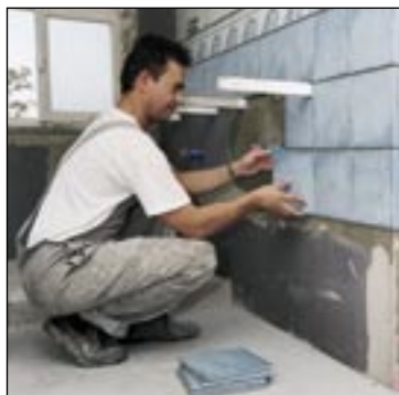
Desky z tvrzených vypěněných hmot včetně tvarovek