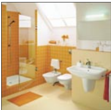
Sprchy a koupelny pro běžná domácí použití