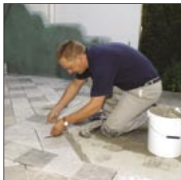
Balkóny a terasy