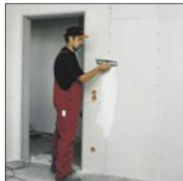
Sádrová omítka, sádrokartonové a sádrovláknité desky