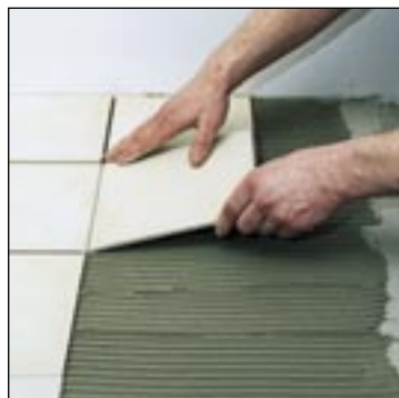
Elektrické podlahové vytápěcí systémy