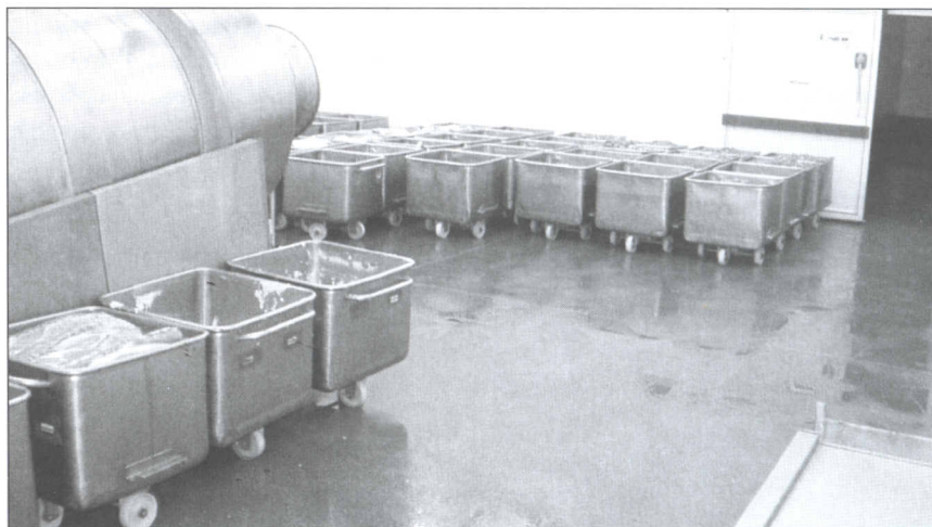
Obr. 1 – Rekonstruovaná podlaha – zpracování masa.

V potravinářských provozech provádí kontrolní činnost především Krajská veterinární správa, Krajská hygienická stanice, Česká zemědělská a potravinářská inspekce a Státní inspekce jakosti. Tyto kontrolní úřady prostřednictvím jejich zákonů a pro-