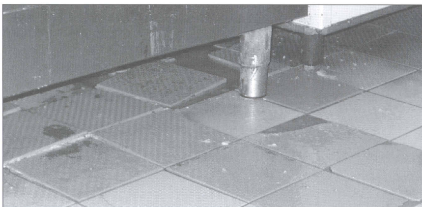
Obr. 3 – Oddutá dlažba

Všechny čtyři kontrolní orgány nemusí být přítomny výstavbě a rekonstrukci a nemusí připomínkovat projekt (výjimkou jsou restaurace a jídelny veřejného stravování, kde Hygienická stanice schvaluje projekt). Povinností provozovatele je oznámit den započetí výroby, resp. uvedení provozovny do provozu a od tohoto dne mohou kontrolní orgány kontrolovat jakoukoliv stavební část provozu a tedy i podlahu – proto je už od projektu doporučeno konzultovat potřebné záležitosti, aby nedocházelo ze strany kontrolních orgánů k pozdějším zásadním připomínkám ke stavební části včetně podlahy.