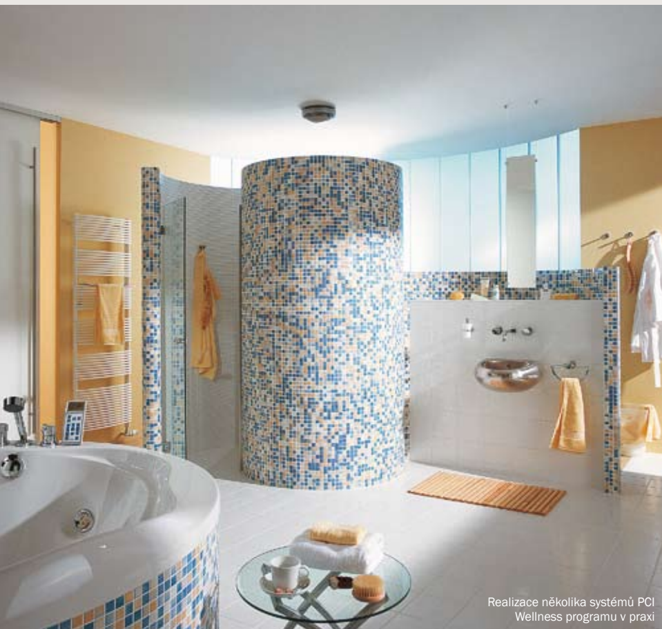
Realizace několika systémů PCI Wellness programu v praxi

Přes 50 let nabízí firma PCI, součást nadnárodního koncernu BASF, své funkční a dokonalé výrobky určené pro profesionály v oblasti izolace, pokládky a spárování obkladů a dlažeb z keramiky a přírodního kamene. V 80. letech minulého století přišla firma PCI s prvním flexibilním lepidlem PCI Flexmörtel a v roce 2003 s prvním lepidlem z oblasti nanotechnologie – PCI Nanolight.