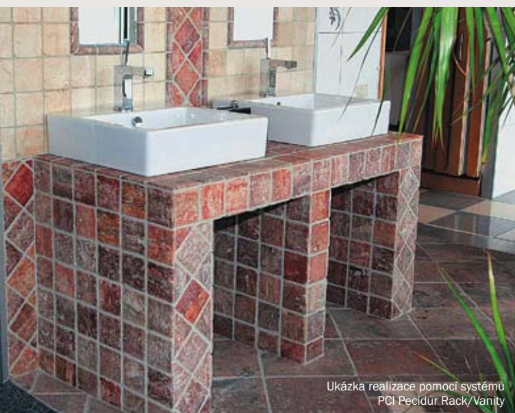
Ukázka realizace pomocí systému PCI Pecidur Rack/Vanity