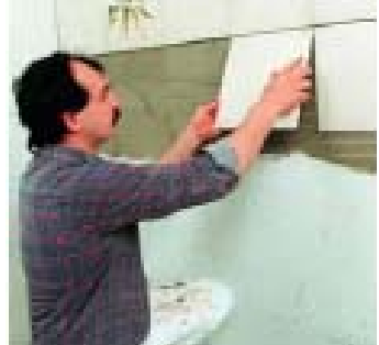
S lepidly PCI Flexmörtel a PCI Flexmörtel Schnell se mohou pokládat obklady a dlažby i na předpjaté podklady, např. betonové prefabrikáty