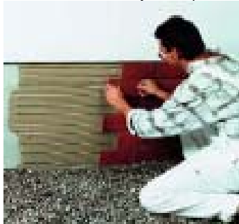
Pokládání keramických obkladů s lepidly PCI Flexmörtel a PCI Flexmörtel Schnell na sokly budov