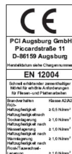
PCI Flexmörtel ® Schnell