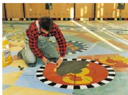
Spolehlivé pokládání obkladů s PCI Flexmörtel a PCI Flexmörtel Schnell.