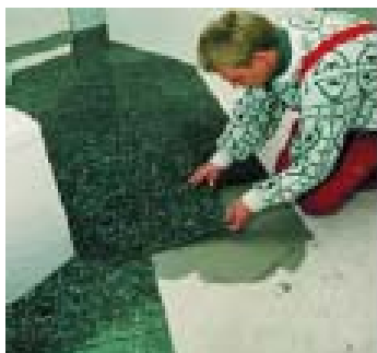
Keramické dlažby lze s lepidly PCI Flexmörtel a PCI Flexmörtel Schnell s jistotou pokládat na cementové potěry