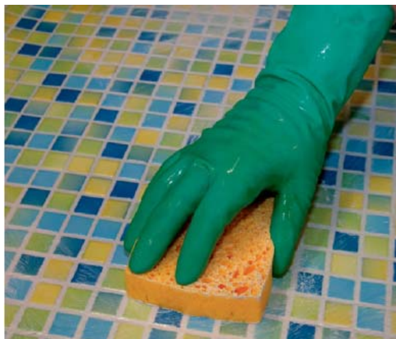
Vyspávané obložení se umyje jemnou houbou.

5.3. Pro snadnější čištění zbylého filmu pryskyřice (po cca 15 minutách) se do teplé vody na čištění může přidat běžná kyselina citrónová (poměr míchání 50 g kyseliny citrónové na cca 6 litrů vody). Zbytky malty z dlažby (cementový šlem) se mohou také odstranit takovým roztokem. Ke snadnému čištění silnějších koncentrací zbytků lze použít čisticí prostředek PCI RS-Reiniger-Extra.