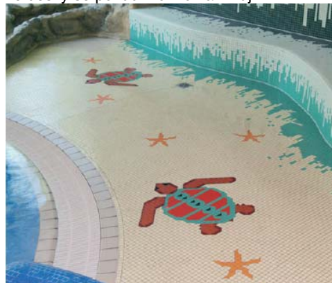
Materiály PCI Durapox NT a PCI Durapox NT plus jsou vhodné pro vyspárování mozaiky plaveckých bazénů.