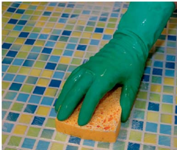
Vyspávané obložení se umyje jemnou houbou.

5.3. Pro snadnější čištění zbylého filmu pryskyřice (po cca 15 minutách) se do teplé vody na čištění může přidat běžná kyselina citrónová (poměr míchání 50 g kyseliny citrónové na cca 6 litrů vody). Zbytky malty z dlažby (cementový šlem) se mohou také odstranit takovým roztokem. Ke snadnému čištění silnějších koncentrací zbytků lze použít čisticí prostředek PCI RS-Reiniger-Extra.