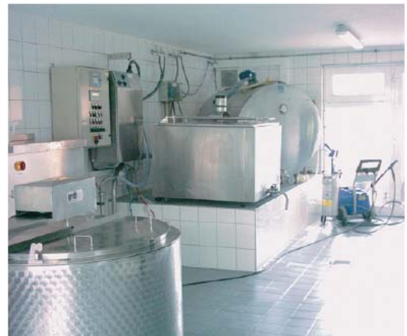
Obklady a spárování vysoce odolné proti opotřebení a chemickému zatížení např. v mlékárnách.